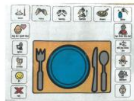
Piktogrammet drengen bruger når han spiser på værelset.

hvordan man kommunikerer forskellige behov, som fx at han er færdig, vil have mere, at maden er for varm og hvor på bordet servicen skal befinde sig.