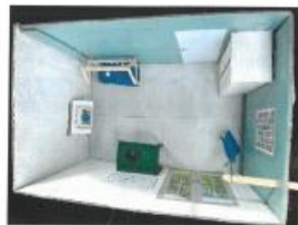
Prototypen af drengens nye værelse.

“Motivation er en indre tilstand, som vækker, guider og fastholder adfærd”