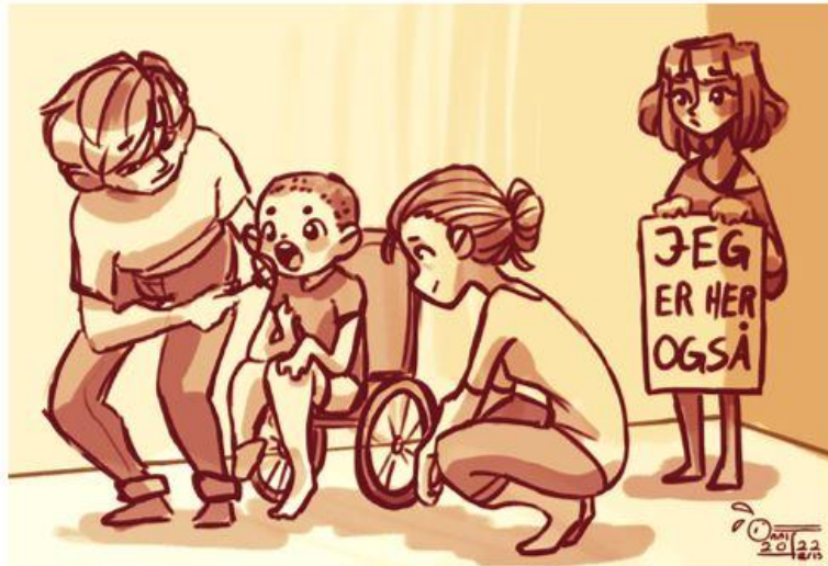
SIBS - projekt for søskende som pårørende og deres forældre

SIBS-projektet er et tilbud til dig mellem 8 og 16 år, der har en bror eller søster med handicap eller er samboende søskende.